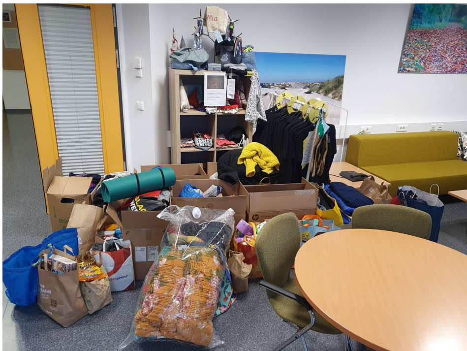
Am Ende kamen viele Spenden zusammen.