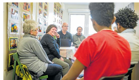
Lotse-Sprechstunde im Container: In der Flüchtlingsunterkunft im Ellerbeker Weg warten viele junge Flüchtlinge auf ihre Chance.

Natürlich weiß Green, dass nur wenige seiner insgesamt rund 150 Schützlinge all diese Anforderungen erfüllen. Aber die Erfahrung hat ihn gelehrt: „Die meisten haben so einen Ehrgeiz, dass sie damit ganz